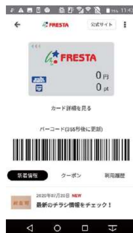
新アプリトップ画面