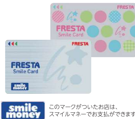
このマークがついたお店は、スマイルマネーでお支払ができます。

2014年9月から発行している「スマイルカード」には、スマイルマネー（電子マネー）機能が搭載されています。レジでの小銭のやりとりがなくスピーディーな精算ができ、お買い物時のポイントはもちろん、チャージ時にも金額に応じてポイントが加算されるためお客さまから大変好評をいただいております。また、自由に金額（3千円～3万円）を選んで贈る「フレスタギフトカード」を販売しております。こちらは、使い切り型の電子マネーギフトカードで、主に祝いや景品・ご贈答にご利用されています。また、フレスタの店頭以外でスマイルカードのポイントが貯まるお店「スマイルショップ」が順次拡大中で、タクシー会社や飲食店などでもポイントがもらえます。詳しくは、フレスタホームページ内「スマイルショップ」にてご確認ください。 ( http://www.frestasmileshop.jp/ )