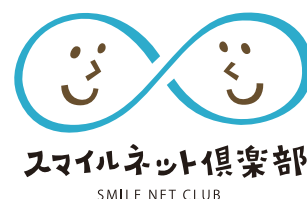
スマイルネット倶楽部 SMILE NET CLUB

スマイルネット倶楽部は、スマイルカード会員さまにインターネットを通じてご利用いただくサービスです。スマイルネット倶楽部に入会いただくと、スマイルカードにご登録されているお客さまの情報を基に、フレスタ店舗、ネットショップ「コンテ・フレスタ」、生鮮宅配「エブリディフレスタ」の各種サービスを横断的にご利用いただくことができ、ポイントサービスの共通化など利便性が向上しました。貯めたポイントを「コンテ・フレスタ」で商品の購入をしたり、電子マネーに交換したりすることもできるようになりました。また、よりフレスタのサービスをお得・便利にご利用いただくために、会員さま限定のメールマガジン、キャンペーンなどの各種コンテンツを用意しています。