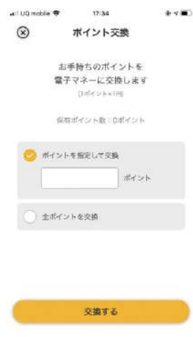
ポイント交換の手順