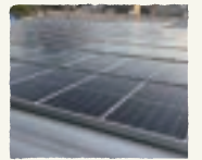
▲自家消費型太陽光パネル設置