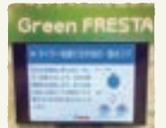
▲「Green FRESTA」の開発 ショーケース、冷蔵冷蔵機、空調設備、照明などを一元管理する店舗統合コントロールシステムを導入し、店舗全体を最適制御することで、省エネに大きく貢献しています。