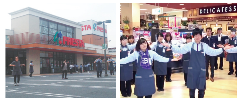
波出石店 週に一度、お客さまと一緒に実施しています。

従業員は、朝礼や社内会議等において“フレスタイソウ”を実施しています。この体操は、お客さまと従業員の健康のために考えられたもので、柔軟体操やストレッチの要素を取り入れ、老若男女誰でも簡単にできるような振り付けになっています。今後も“フレスタイソウ”を通して、お客さまや地域の皆さまとコミュニケーションを深めみんなが笑顔で健康になれる体操として親しんでもらえることをめざします。