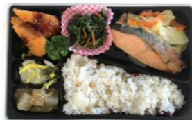
鮭のチャンチャン焼き弁当