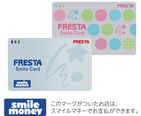
このマークがついたお店は、スマイルマネーでお支払ができます。

2014年9月から発行している「スマイルカード」には、スマイルマネー(電子マネー)機能が搭載されています。レジでの小銭のやりとりがなくスピーディーな精算ができ、お買い物時のポイントはもちろん、チャージ時にも金額に応じてポイントが加算されるためお客様から大変好評をいただいております。また、自由に金額(3千円~3万円)を選んで贈る「フレスタギフトカード」を販売しております。こちらは、使い切り型の電子マネーギフトカードで、主にお祝いや景品・ご贈答にご利用されています。また、フレスタの店頭以外でスマイルカードのポイントが貯まるお店「スマイルショップ」が順次拡大中で、タクシー会社や飲食店などでもポイントがもらえます。詳しくは、フレスタホームページ内「スマイルショップ」にてご確認ください。(http://www.frestasmileshop.jp/)