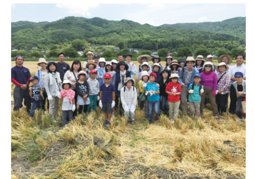
もち麦体験ツアー

2017年6月、安芸高田市甲田町で開催される「もち麦収穫ツアー」に、抽選で選ばれたお客さまが参加しました。鎌を使っての収穫体験や、トラクターへの試乗体験など普段できない体験をしていただき、また、子どもたちにとっても貴重な経験になったというお声を頂戴しました。体験の後は、もち麦を使ったメニューを堪能することができ、大変好評でした。