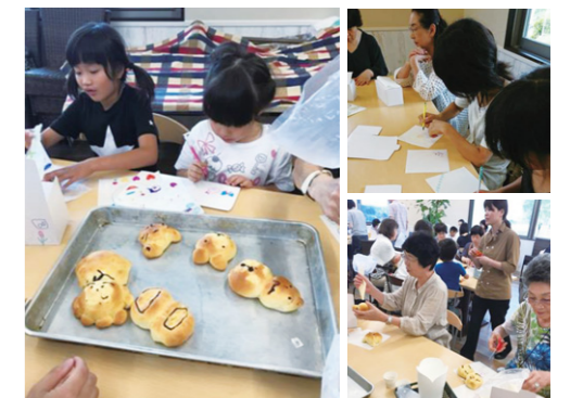
八天堂でのパン作り

2017年7月、東原店では、クリームパンで有名な八天堂へのバスツアーを開催、パンを製造している工場の見学と、クリームパン作りを体験しました。今回は、初めての企画でしたが大人も子どもも楽しめる企画となり、多くのお客さまに喜んでいただきました。